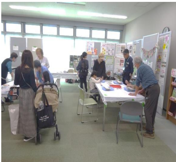
・「勾玉」の作成です 形を作るのに時間がかかります

「勾玉」「くるくるレインボー」は材料費200円をいただきましたが、大人気でした。