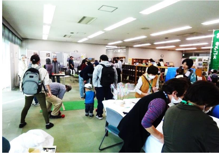
「けん玉」「ベーゴマ」「スカットボール」上手くできたかな？

初めての子どもには難しいですが、慣れてきて上手くいくとみんなで拍手をして喜んでいました。