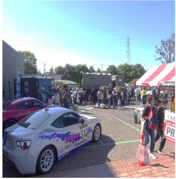
・ 駐車場 人気の車両が展示 親子で記念撮影！

予定のとおり、14:00には終了しましたが、勾玉は製作途中の子どもの為、若干遅くなりました。 後片付けも全員で行い、無事に終了しました。