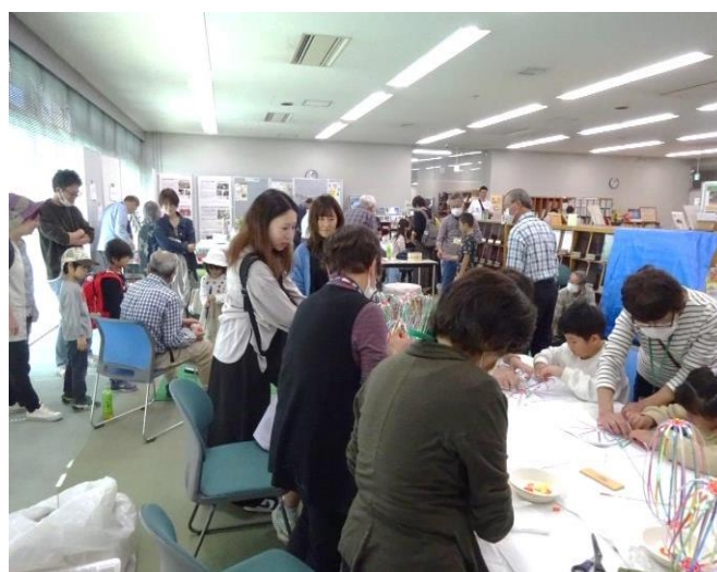
「くるくるレインボー」出来上がりが楽しみです♪