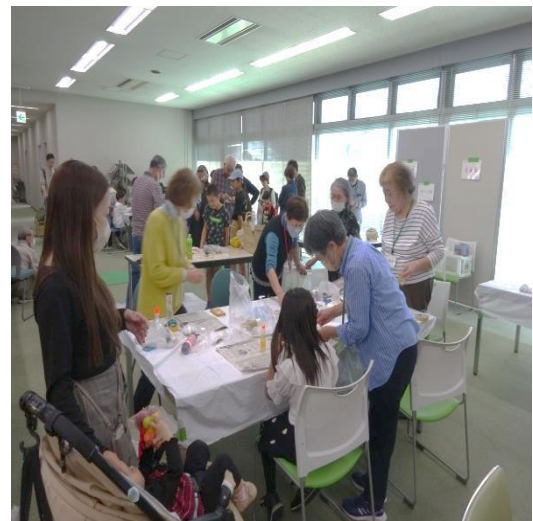
・「万華鏡」親子で作成中 どんな模様になるかな♪