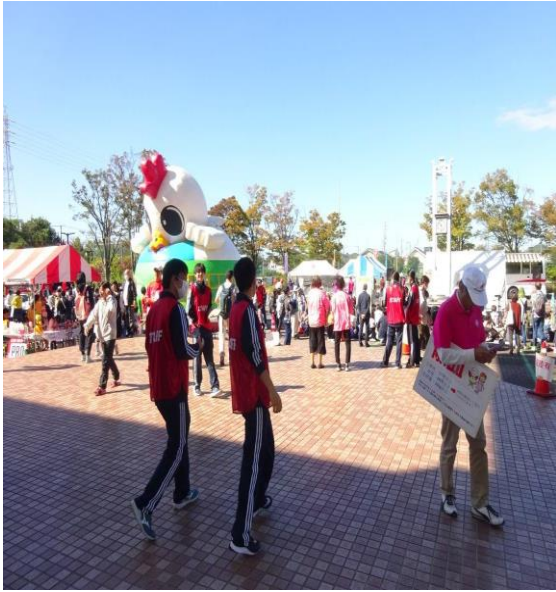
・ 駐車場 秋晴れの好天でした マスコット人形も！